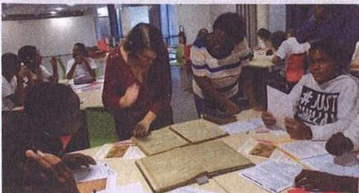
Projet de l'académie de Guadeloupe, intitulé Guadeloupe-Lyon, 2017-2018.

Si des dizaines de journées de formation ont été proposées dans l'ensemble des académies entre 2012 et 2019 sur les problématiques historiques et mémorielles de la Grande Guerre, des partenaires comme l'APHG ont investi le terrain de la formation et de la valorisation des travaux pédagogiques en direction de la communauté éducative jusque dans les Outre-mer. Très mobilisées durant l'ensemble du cycle commémoratif, les quatre académies ultramarines (Guyane, Martinique, Guadeloupe et Réunion) ainsi que le vice-rectorat de la Nouvelle-Calédonie ont profité de plusieurs actions marquantes de formation, en particulier des journées d'étude organisées par l'APHG de l'océan Indien, entre le 29 et le 31 octobre 2018 à Saint-Denis et Saint-Pierre de la Réunion. Intitulées « Le centenaire de la Grande Guerre : bilan et perspectives des travaux menés dans les Outre-mer », ces journées ont permis de faire le point sur la richesse quantitative et qualitative des projets ultramarins, par la succession de conférences et de présentations de travaux. Elles ont contribué à mettre en lumière l'histoire des Outre-mer dans la Grande Guerre, notamment au moment des « sorties de guerre », à valoriser à travers cette vitrine pluridisciplinaire l'engagement des établissements ultramarins, tout en nourrissant la communauté éducative sur ses pratiques et ses ressources propres. Elles ont notamment fait ressortir l'importance de la place des enseignants qui sont au cœur de la sensibilisation mémorielle.